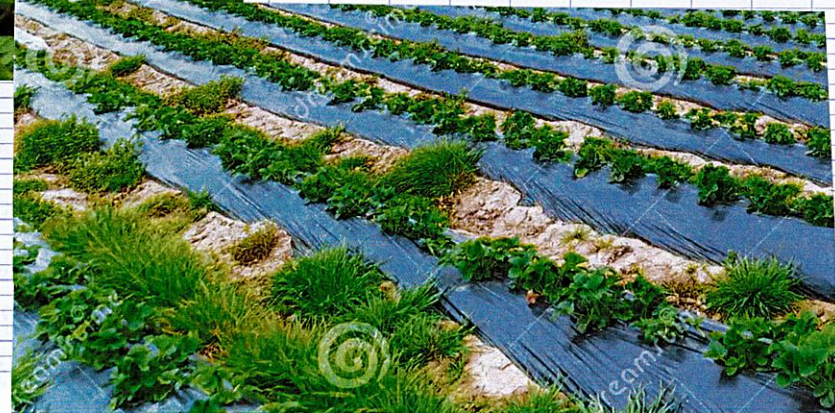
Route des étangs (culture et tourisme)

«... La Dombes cultive les céréales, mais aussi les produits maraîchers. Les fermes, ou exploitations agricoles, offrent un rendement considérable. 90% de ces produits sont cultivés naturellement...»