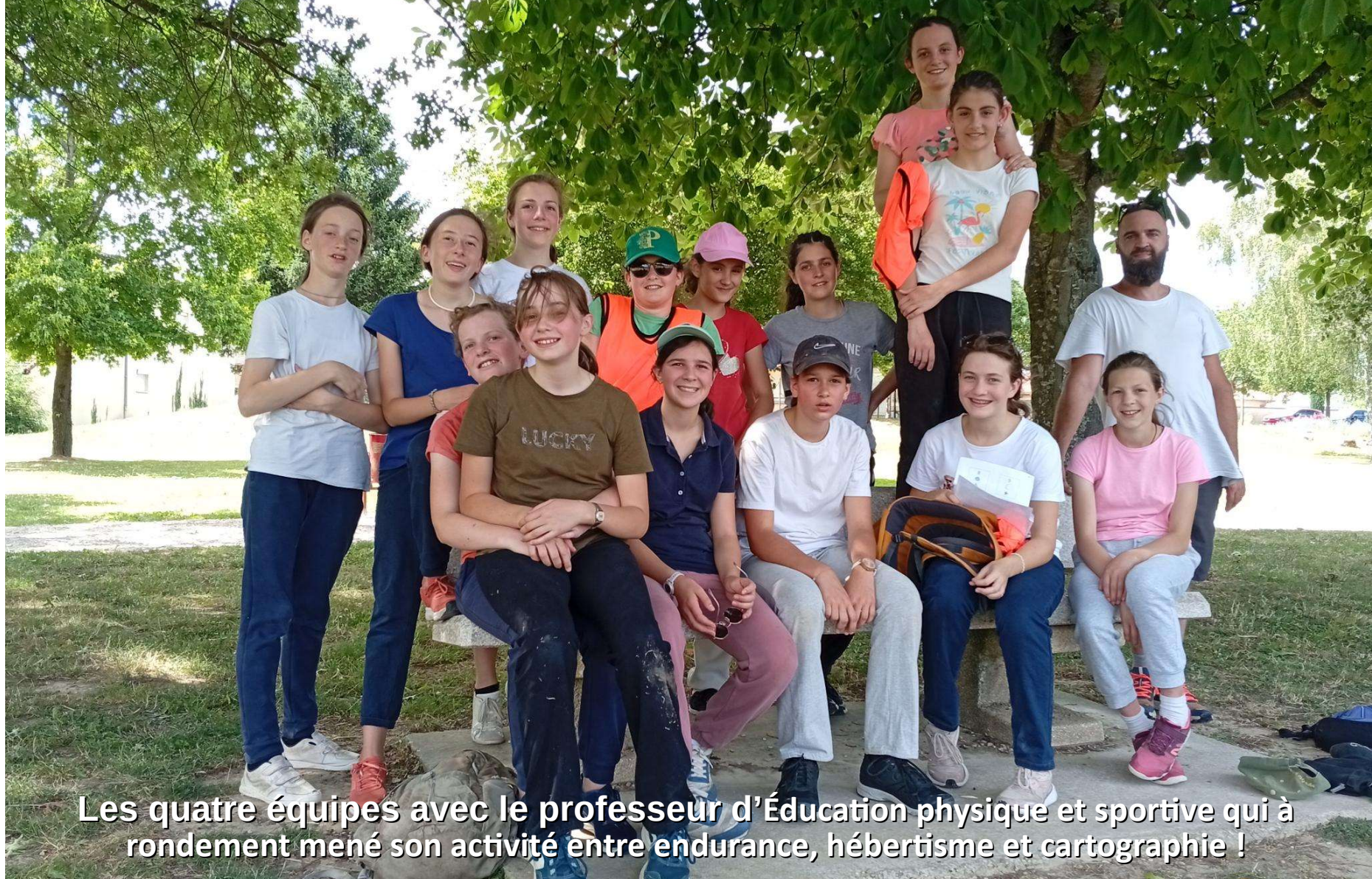
Les quatre équipes avec le professeur d'Éducation physique et sportive qui à rondement mené son activité entre endurance, hébertisme et cartographie !